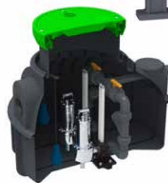
Station de relevage 1200