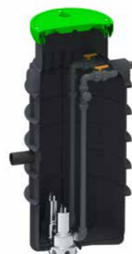
Station de relevage 800