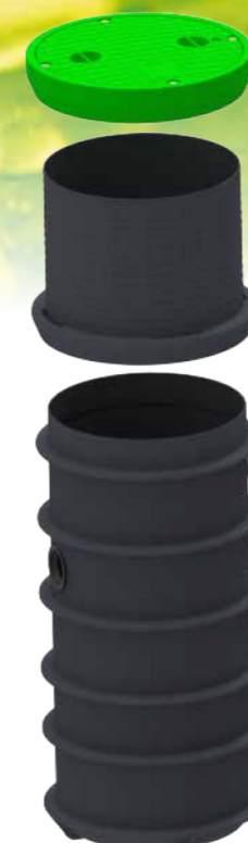
Station de relevage 600