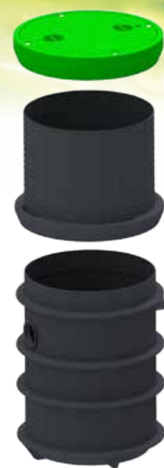
Station de relevage 600