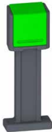
Coffret de gestion 2 pompes