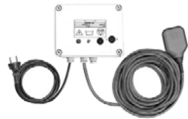
Alarme trop plein