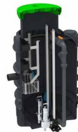
Station de relevage 1000