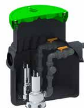
Station de relevage 800