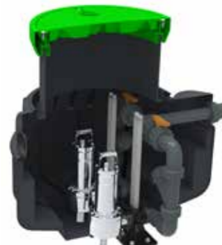
Station de relevage 1000